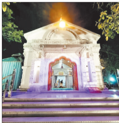
का विशेष महत्व होने के कारण लोग अन्न, वस्त्र और तिल-गुड़ का दान करते हैं। नगर के मंदिरों में विशेष पूजा-अर्चना और भजन-कीर्तन के आयोजन किए जाते हैं। मनेन्द्रगढ़ क्षेत्र में मकर

मनेन्द्रगढ़ सहित पूरे अंचल में पर्व को लेकर उत्साह का माहौल है और तैयारियों जोरों पर चल रही हैं। धार्मिक मान्यताओं के अनुसार मकर संक्रांति के दिन सूर्यदेव की आराधना करने से सुख-समृद्धि और आरोग्य की प्राप्ति होती है। इस अवसर पर तिल, गुड़, खिचड़ी और तिल से बने व्यंजनों का सेवन किया जाता है, जो स्वास्थ्य के लिए फायदेमंद माने जाते हैं। दान-पुण्य