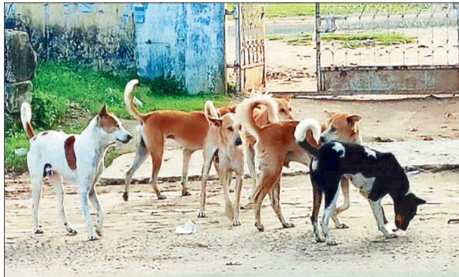
स्कूल परिसर के बाहर घूमते कुत्ते।

स्कूल परिसर में आवारा कुत्ते आए दिन नजर आते रहते हैं, इसके चलते स्कूली बच्चों एवं लोगों को हमेशा ही खतरा मंडराते रहता है। स्कूल परिसर में आवारा कुत्ता प्रवेश न करें, इसके निगरानी के लिए नोडल अधिकारी नियुक्त किए गए हैं जो केवल स्कूल परिसर की दीवार पर नोडल अधिकारी का नाम, मोबाइल नंबर अंकित कर दिया गया है। कई विद्यालयों में तो नोडल अधिकारी का नाम विद्यालय परिसर में कहीं पर भी दिखाई नहीं देता। कोरिया-एमसीबी जिले के कई विद्यालयों जिनमें ज्यादातर वे स्कूल हैं, जहां मध्याह्न भोजन बनता है, वहां आए दिन आवारा कुत्ता विद्यालय परिसर में दिखाई देते हैं, इससे बच्चों की सुरक्षा खतरों में पड़ सकती है। कुछ समय पूर्व स्कूल प्राचार्य एवं हेडमास्टर्स को स्कूल परिसर में