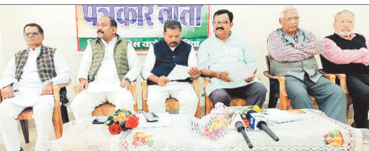
जिला कांग्रेस कार्यालय राजीव भवन में आयोजित प्रेसवार्ता।

नेताओं ने संबोधित करते हुए कहा कि वर्ष 2005 में यूपीए सरकार द्वारा लागू किया गया महात्मा गांधी राष्ट्रीय ग्रामीण रोजगार गारंटी अधिनियम (मनरेगा) महज एक योजना नहीं, बल्कि ग्रामीण परिवारों को सम्मान से जीने का अधिकार देने वाला कानून है। इस कानून के तहत प्रत्येक परिवार को 100 दिन के रोजगार