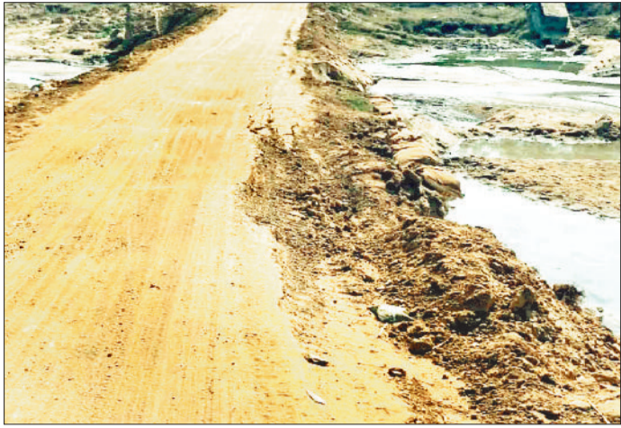
जुगाड़ का कच्चा रपटा।